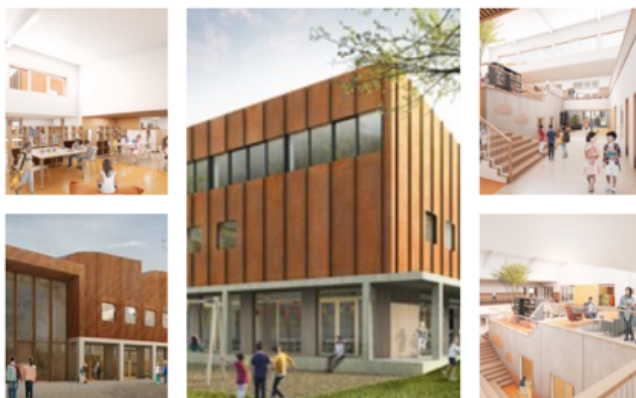
Kindcentrum De Samenstroom

Aanstaande maandag hopen we met de gemeente overeenstemming te hebben over de buitenruimte waar onze leerlingen gaan spelen en leren. We gaan voor een groene, uitdagende speel/leer omgeving voor onze leerlingen!